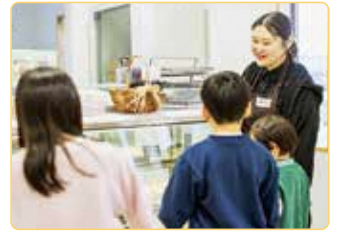
現在は3児の母として忙しい日々を送ります